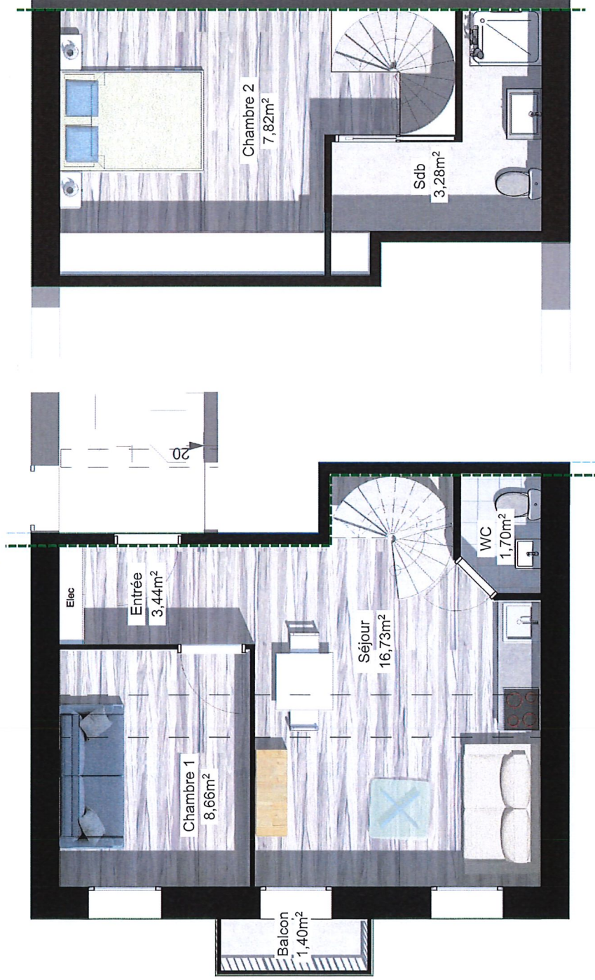
Plan duplex niveau bas