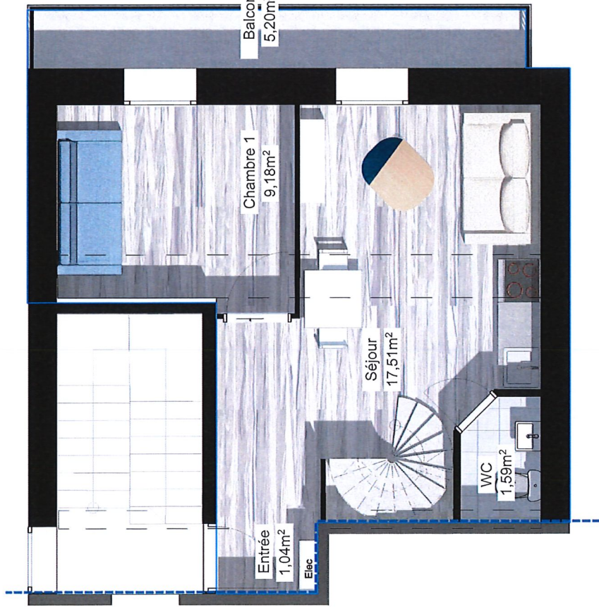
Plan duplex niveau bas